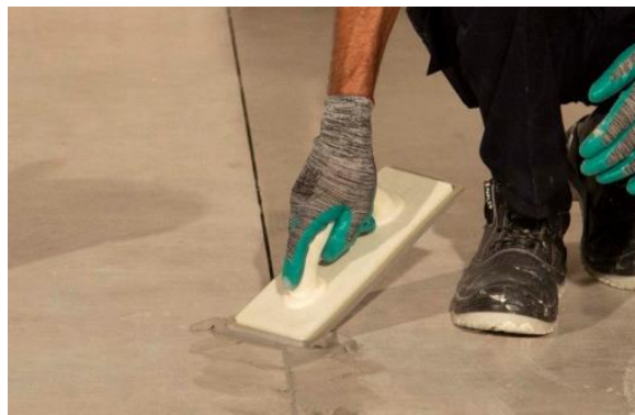
پر کردن بندها با ماده بندکشی