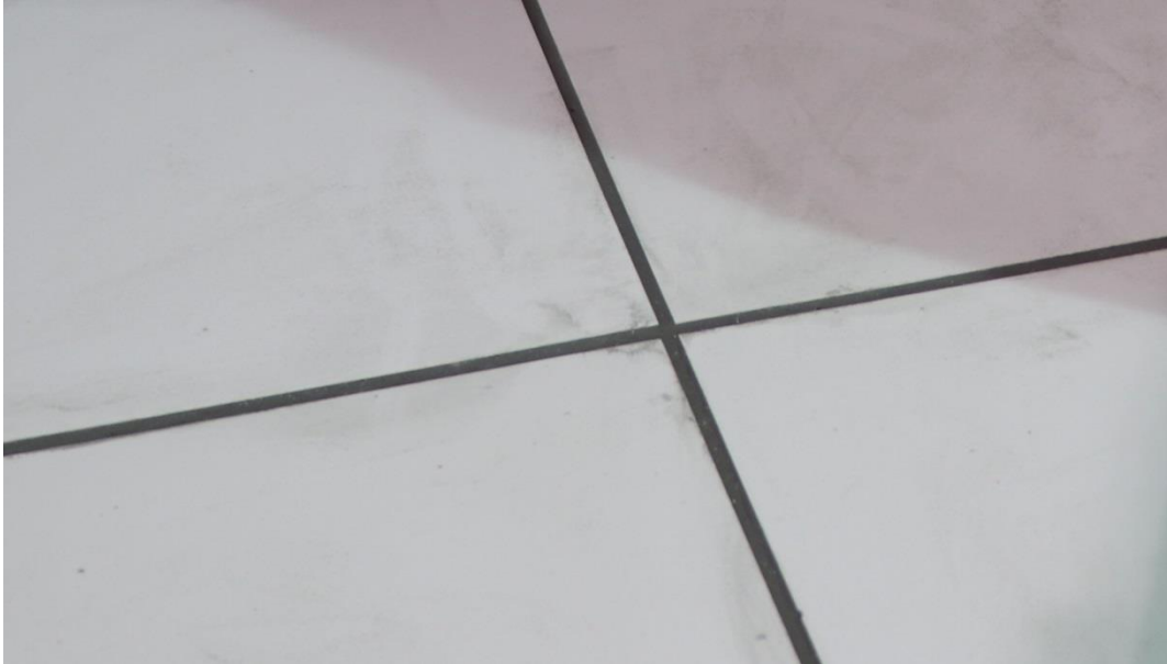
کنتراست رنگ ماده بندکشی با رنگ سرامیک

* در انتخاب رنگ ماده بندکشی، توصیه می‌شود که همه جوانب در نظر گرفته شوند؛ چنانچه رنگ مواد بندکشی با رنگ سرامیک دارای کنتراست باشد، جلوه بندکشی بیشتر شده و اگر ناموزونی در آن وجود داشته باشد، این موضوع بیشتر به چشم می‌آید. از سوی دیگر چنانچه رنگ بندکشی مشابه رنگ سرامیک باشد اثرات به جا مانده از عملیات بندکشی دیده نخواهد شد و تنظیف آن دشوار می‌شود.