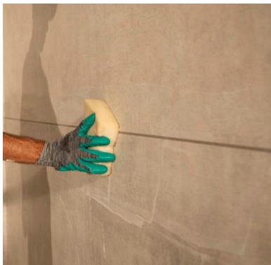
نظافت بندها با اسفنج مرطوب