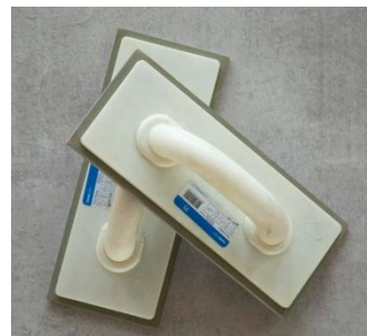
ماله لاستیکی برای پر کردن بندها