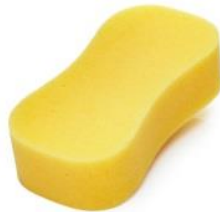
اسفنج جهت نظافت سطح بندها