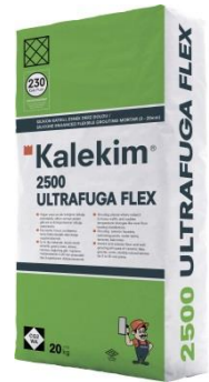
پودر بندکشی پایه سیمان