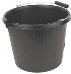
سطل مناسب جهت آماده سازی پودر بندکشی